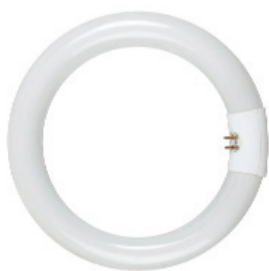
T9 Ref. 9192C320 32 W. Blanco frío. Casquillo T9.